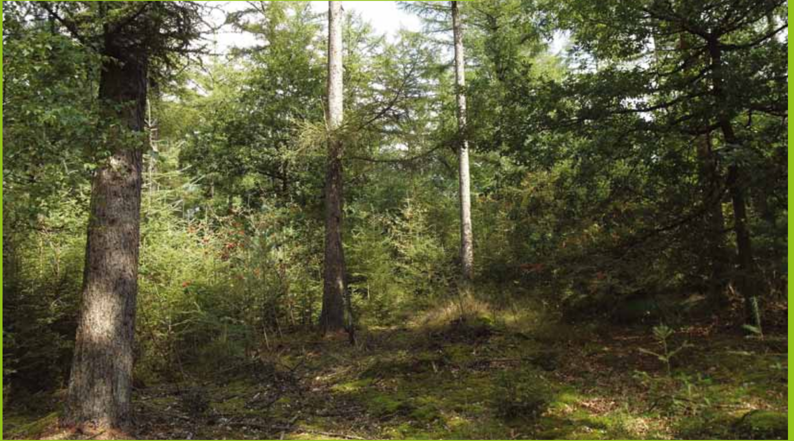
Ruinen, vak 64. Er is door het doordunnen ruimte voor de tweede boometage.