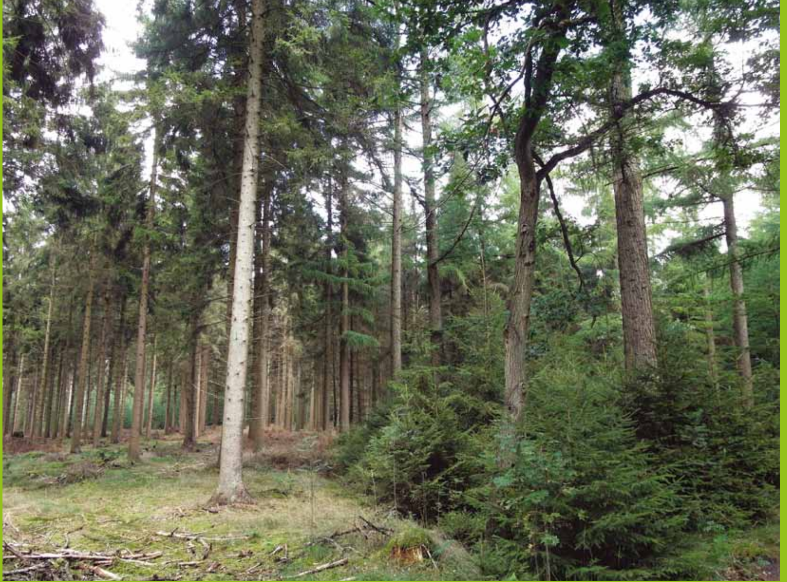
Links op de foto de fijnspar van vak 35, rechts een opstand Japanse lariks vergelijkbaar met de lariks van vak 27.