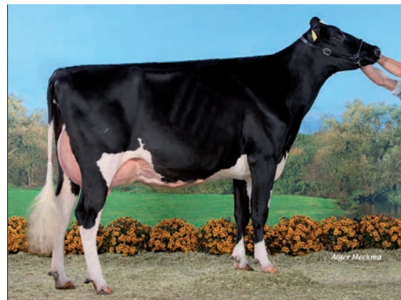
Topcross Anna 237 (v. Jordan), kamp. vaarzen Prod.: 2.02 57 2008 3,89 3,10 lw 109 i.l.