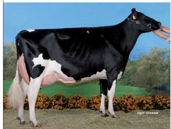
Anita 54 (v. Goldwyn), alg. kampioene Prod.: 4.06 362 11.385 4,48 3,63 lw 103

Nog één titel was er te verdelen; wie zou het algemeen kampioenschap winnen? Nogmaals gaf de puike melkklier van Anita 54 de doorslag; de Goldwyndochter won het algemeen kampioenschap. |