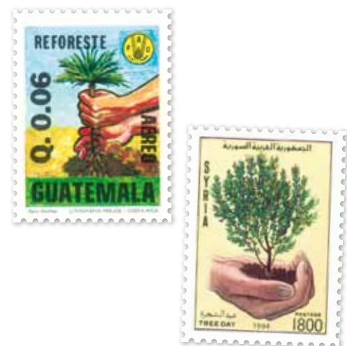
Alle postzegels uit Pieters eigen postzegelverzameling

Als lekkermakertje voor de journalisten werd ons het neusje van de bosbouwtechniek getoond: Boomuitsleep met een mobiele kabelbaan op een berghelling over een lengte van maximaal 1000 meter. De gehele boom hangt aan twee kraantjes op de kabel en wordt zo