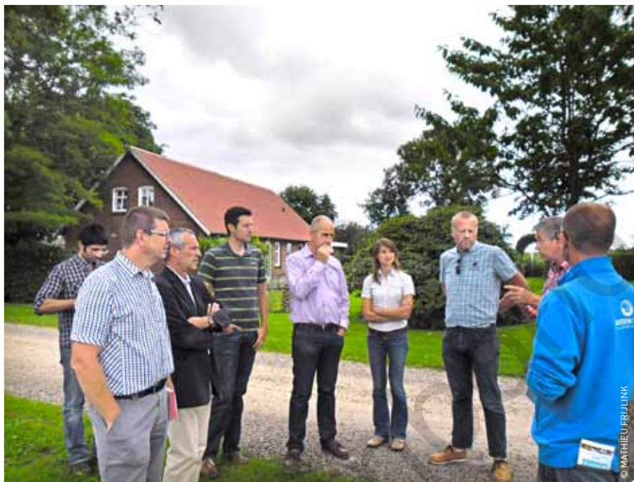
Op de jaarlijkse studiereis maakten de rundveeconsulenten van Boerenbond kennis met de Deense melkveehouderij, een sector in crisis.

In Vlaanderen zit op veel gronden speculatieve waarde en zijn er bovendien ook heel wat geïnteresseerden van buiten de landbouw, die als plattelanders hun eigen stukje open ruimte willen inrichten en beheren. Hierdoor is de kans dat de grondmarkt instort veel kleiner dan in andere dunbevolkte gebieden zoals Denemarken. Tot slot verdient het Deense financieringsmodel een verdere analyse.