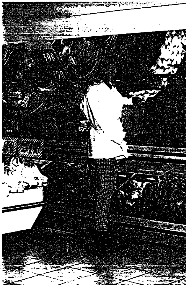
Versproducten vergen doorgaans meer ketencoördinatie dan verduurzaamde levensmiddelen.

Een interessant voorbeeld van ketensamenwerking tussen producenten en detailhandel is het Efficient Consumer Response (ECR) initiatief. ECR is geïnitieerd door wensen vanuit de detailhandel, maar is vooral mogelijk geworden door technologische vooruitgang. Het is in eerste aanleg erop gericht om, aan de hand van de nieuwste planning-