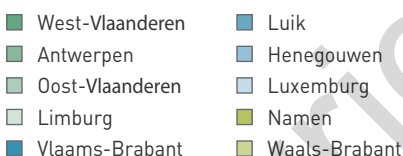
Figuur 1 Geografische spreiding van de Belgische melkquota (% van de melkquota)

Totaal melkquotum = 3.351.659.599 l (100%)