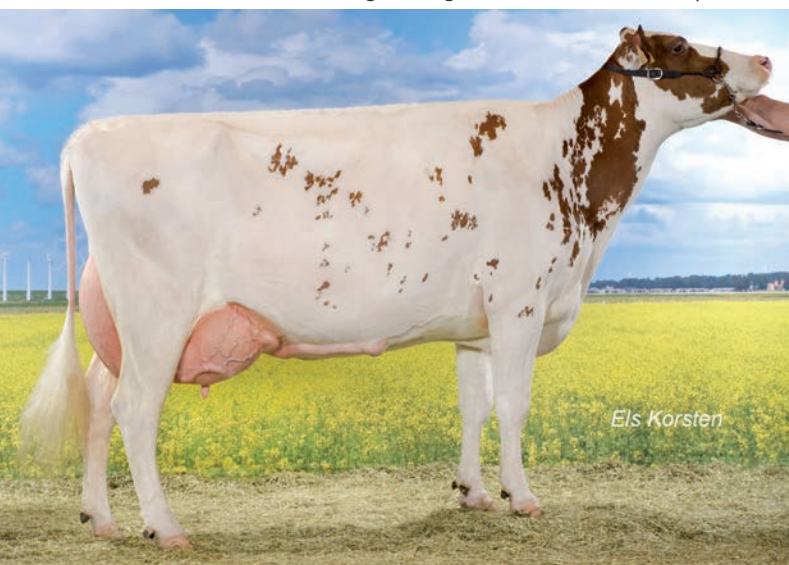
Annelies (v. Classic) kreeg als enige Vlaamse roodbonte 91 punten