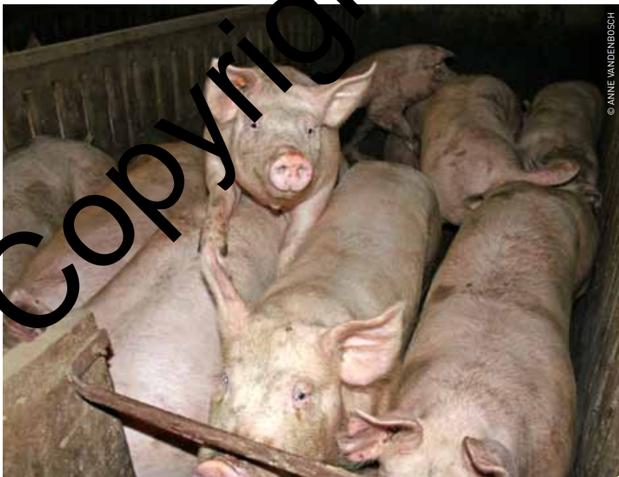
De krachtvoederkosten bleven ook in 2011 te hoog om een redelijk familiaal arbeidsinkomen te halen.

en de opbrengst volgt min of meer het verloop van de krachtvoeder-, de biggen- en de vleesvarkensprijs. Na een periode van werken met verlies, wordt vanaf mei 2008 het FAI weer positief. De opbrengst neemt toe door de stijging van de vleesvarkensprijs en de kost neemt af door een daling van de krachtvoederprijzen. Tot september 2010 blijft het FAI positief. Het FAI wordt vanaf september 2010 negatief. Dat is het gevolg van een sterke stijging van de krachtvoederprijzen en een seizoenscyclische daling van de varkensprijs. Het dieptepunt bevindt zich in januari met -17 euro per vleesvarken. De rentabiliteit staat tot april 2011 zeer zwaar onder druk. Maar ook daarna brengt de relatieve hoge vleesvarkensprijs weinig soelaas. De krachtvoederkosten blijven te hoog om een redelijk FAI te halen. ■