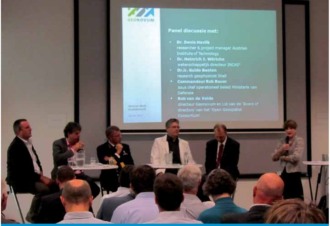
Fig. 2. Panelleden wordt het hemd van het lijf gevraagd.