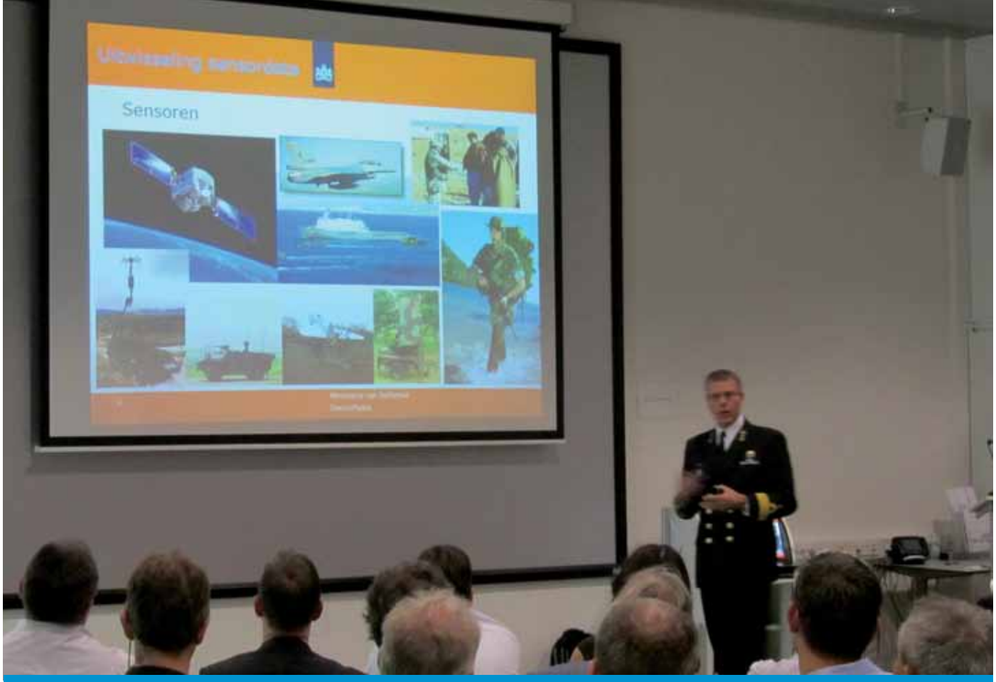
Fig. 1. Uitwisseling van sensorgegevens is ook voor defensie belangrijk.

gen in het stedelijk gebied. Sensor City wil door toepassingen van sensoren actuele verkeerssituaties in kaart brengen en hierop het verkeersmanagement aanpassen voor zowel de doorstroming als het optimaliseren van de aanrijdtijd. Beide sprekers zijn betrokken bij diverse projecten, waarbij sensornetwerken worden ingezet om de oorzaken van geluidsoverlast in beeld te brengen. SWE wordt wel onderkend als een manier om uniform gegevensoverdracht tussen verschillende disciplines mogelijk te maken, maar wordt nog niet gebruikt.