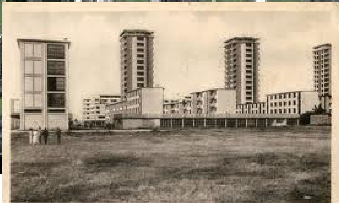
408 DRANCY — Les Premiers Grands-Ciel de la Région Parisienne