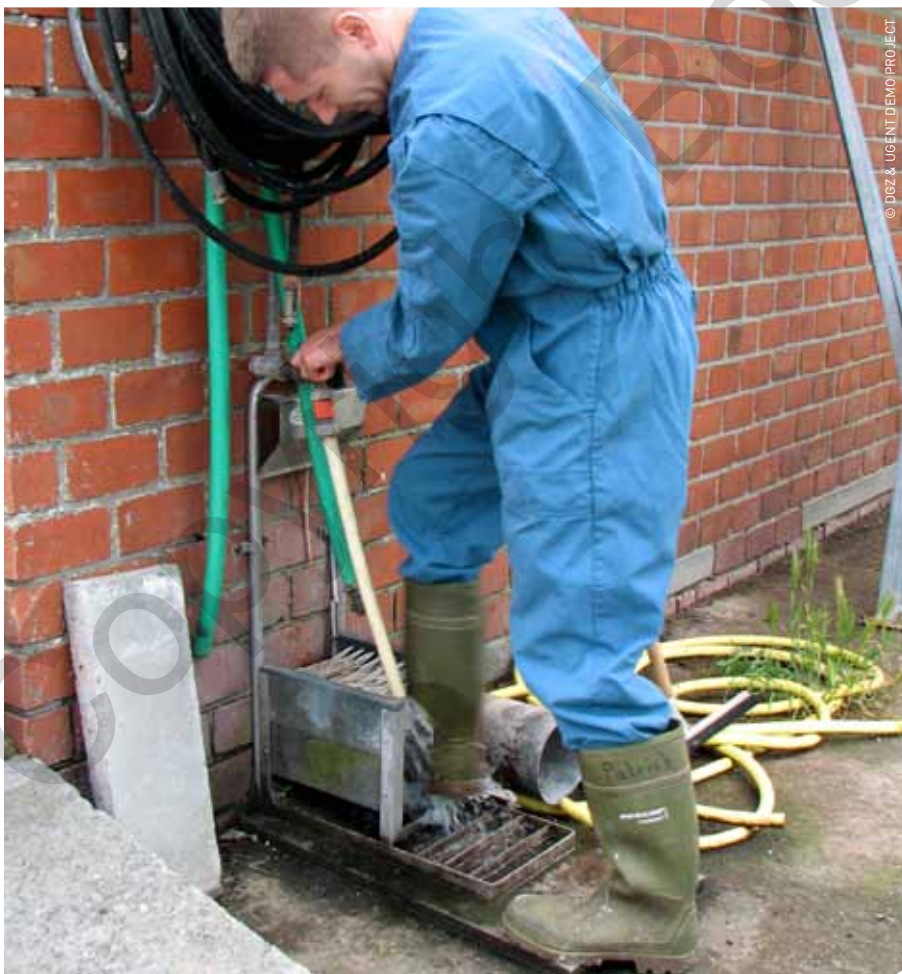
Het dragen van propere laarzen wordt door veehouders in de pluimvee-, de varkens- en de rundveehouderij als erg belangrijk beschouwd.

Aangezien is gebleken dat niet iedereen aan dierziektepreventie doet, is het ook belangrijk om te kijken wat veehouders tegenhoudt. De meerderheid van de veehouders in de 3 sectoren geeft aan dat er eigenlijk niets hen tegenhoudt. Andere antwoorden zijn 'te duur', 'te veel werk' en 'geen beloning'. Het is opvallend dat men eerst aangeeft dat het doen aan dierziektepreventie zal zorgen voor een hogere opbrengst, maar dat men nadien aangeeft dat het te duur is. Dit is natuurlijk tegenstrijdig. Als er verder gevraagd wordt naar hoe de veehouder wel te motiveren