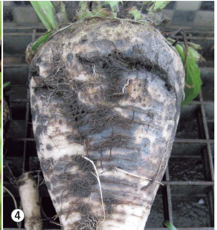
4 Rhizoctonia begint met kleine, ronde, zwarte vlekjes op de kop van de biet.

gevolg van stengelaaltjes in het veld, zodat u bij een volgende bietenteelt weet waar u maatregelen moet treffen. Dit kan door Vydate in de zaaivoer toe te passen met een granulaatstrooier.