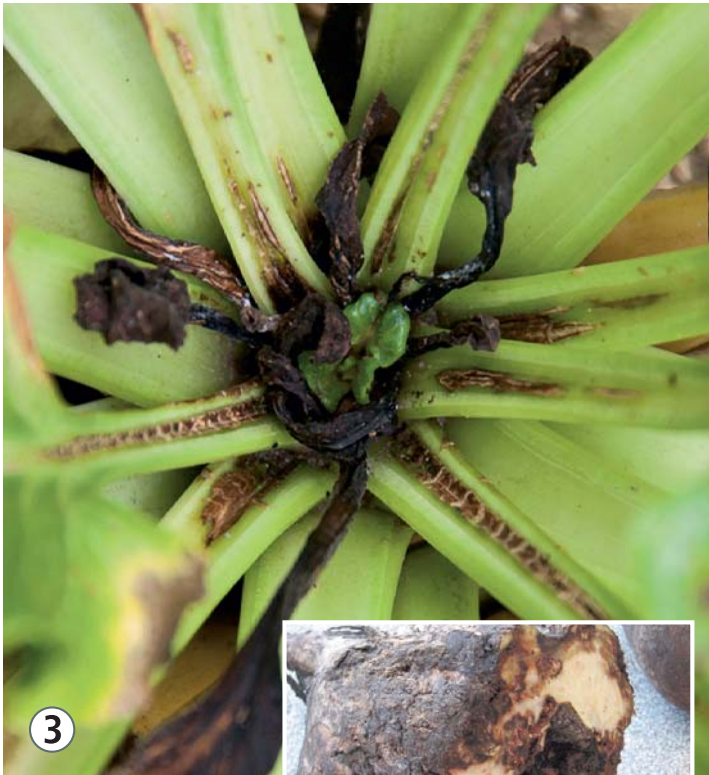
3 Bij boriumgebrek zijn zwarte harten zichtbaar. Het wortelrot begint daarom ook vanuit het hart.