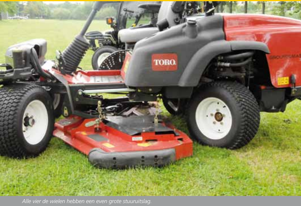
Alle vier de wielen hebben een even grote stuuruitslag.

cabinemachine die voor de meeste aannemers duidelijk favoriet is, zal dat wat minder makkelijk gaan. Opmerking is ook dat de achterbrug van de machine binnen de draaicirkel van het dek blijft. Dat merken we als we langs een muur maaien en scherp wegdraaien. De kont van de machine blijft mooi binnen de draaicirkel en raakt de muur niet.