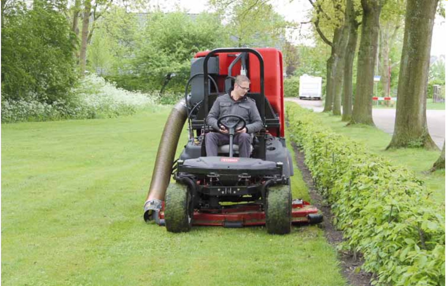
Toro 360 met hoogkiepende opvang