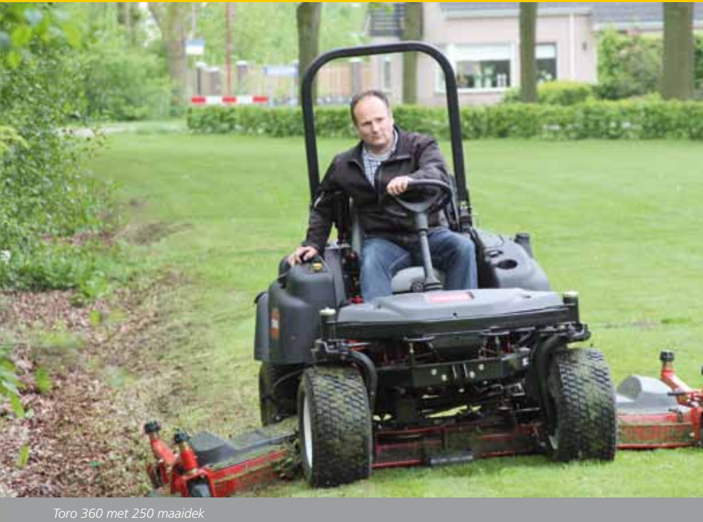
Toro 360 met 250 maaidek

lost door middel van een speciale transportinstelling. De achterwielen worden daarbij geblokkeerd, wat zou moeten resulteren in een betere controle over de machine op de weg.