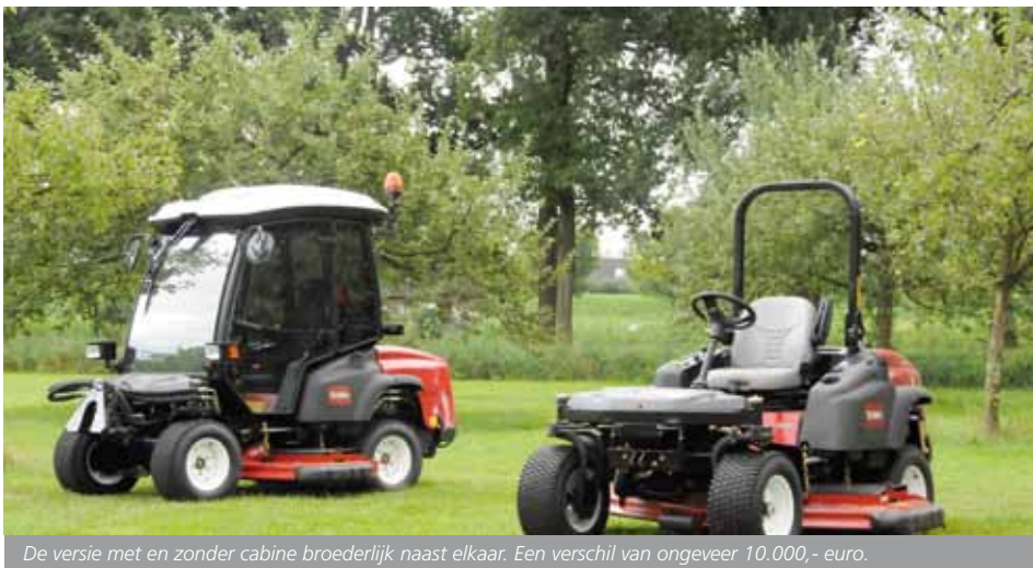
De versie met en zonder cabine broederlijk naast elkaar. Een verschil van ongeveer 10.000,- euro.

de grotere maaier de grotere ligweides. Normaal zal een ervaren machinist rondom bomen en andere obstakels maaien door heen en terug te steken. Dat kost natuurlijk tijd. De Toro 360 is de enige maaier waarmee je vanwege de geringe draaicirkel niet hoeft te steken. Dat bespaart behoorlijk wat tijd. De tweede tijdswinst zou geboekt worden doordat je korter op obstakels kunt maaien en je dus minder hoeft bij te maaien met de bosmaaier. Dat laatste moet ook Weijers toegeven. De testdrive vindt plaats op een hoogstamboomgaard in Houten. Met de tweewielaangedreven machine zonder cabine, waarvan we tegen alle regels in de veiligheidsbeugel hebben neergeklapt, kunnen we makkelijk onder de hoogstamappels komen. Met een