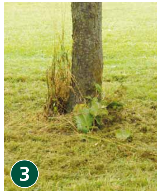
Maaien rondom boom in 3 stappen.