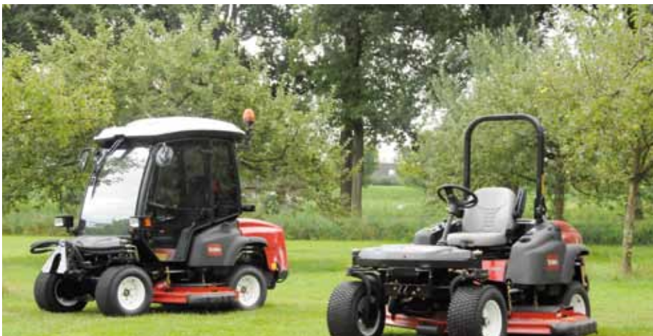
De versie met en zonder cabine broederlijk naast elkaar. Een verschil van ongeveer 10.000,- euro.

de grotere maaier de grotere ligweides. Normaal zal een ervaren machinist rondom bomen en andere obstakels maaien door heen en terug te steken. Dat kost natuurlijk tijd. De Toro 360 is de enige maaier waarmee je vanwege de geringe draaicirkel niet hoeft te steken. Dat bespaart behoorlijk wat tijd. De tweede tijdswinst zou geboekt worden doordat je korter op obstakels kunt maaien en je dus minder hoeft bij te maaien met de bosmaaier. Dat laatste moet ook Weijers toegeven. De testdrive vindt plaats op een hoogstamboomgaard in Houten. Met de tweewielaangedreven machine zonder cabine, waarvan we tegen alle regels in de veiligheidsbeugel hebben neergeklapt, kunnen we makkelijk onder de hoogstamappels komen. Met een