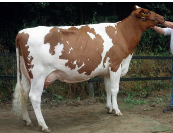
Els 286 (v. Burnstyn), kampioene roodbont vaarzen Prod.: 2.01 350 8523 5,40 4,09 117 lw l.l.