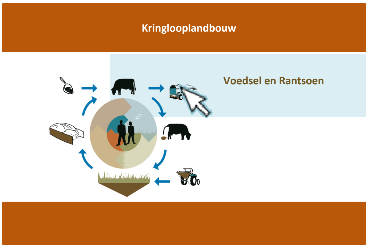
Figuur 1. Hoofdmenu