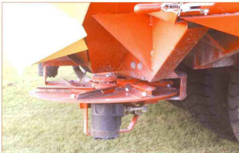
Achteraanzicht machine met een van de schijven

interne band in de machine is verder traploos instelbaar. Op deze manier is de hoeveelheid topdressing na wat experimenteren makkelijk instelbaar."