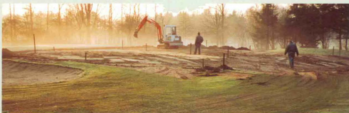
Met minigravers worden sleuven van de drainage gegraven.