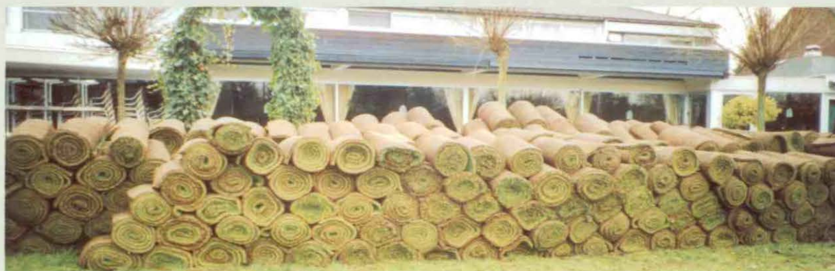
Graszoden afgesneden en apart gezet.