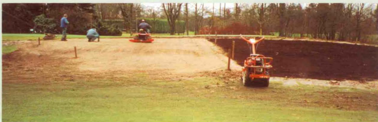
De toplaag is half klaar. Op het rechter deel is de champignonmest al ingefreesd.