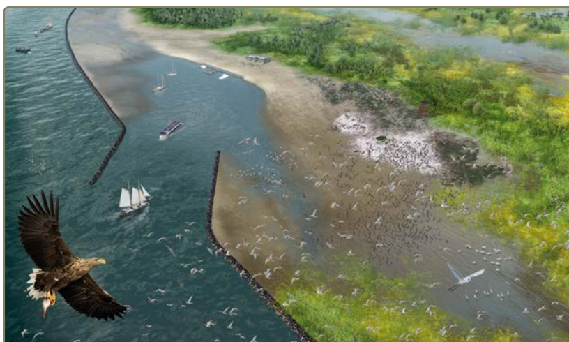
Prognose sportvisserijmogelijkheden 2030

■ Reguliere sportvisserij door Nederlanders - € 2.230.000 ■ Vischarters - € 320.000 ■ Visgidsen - € 300.000 ■ Sportvisserij door buitenlandse toeristen - € 100.000