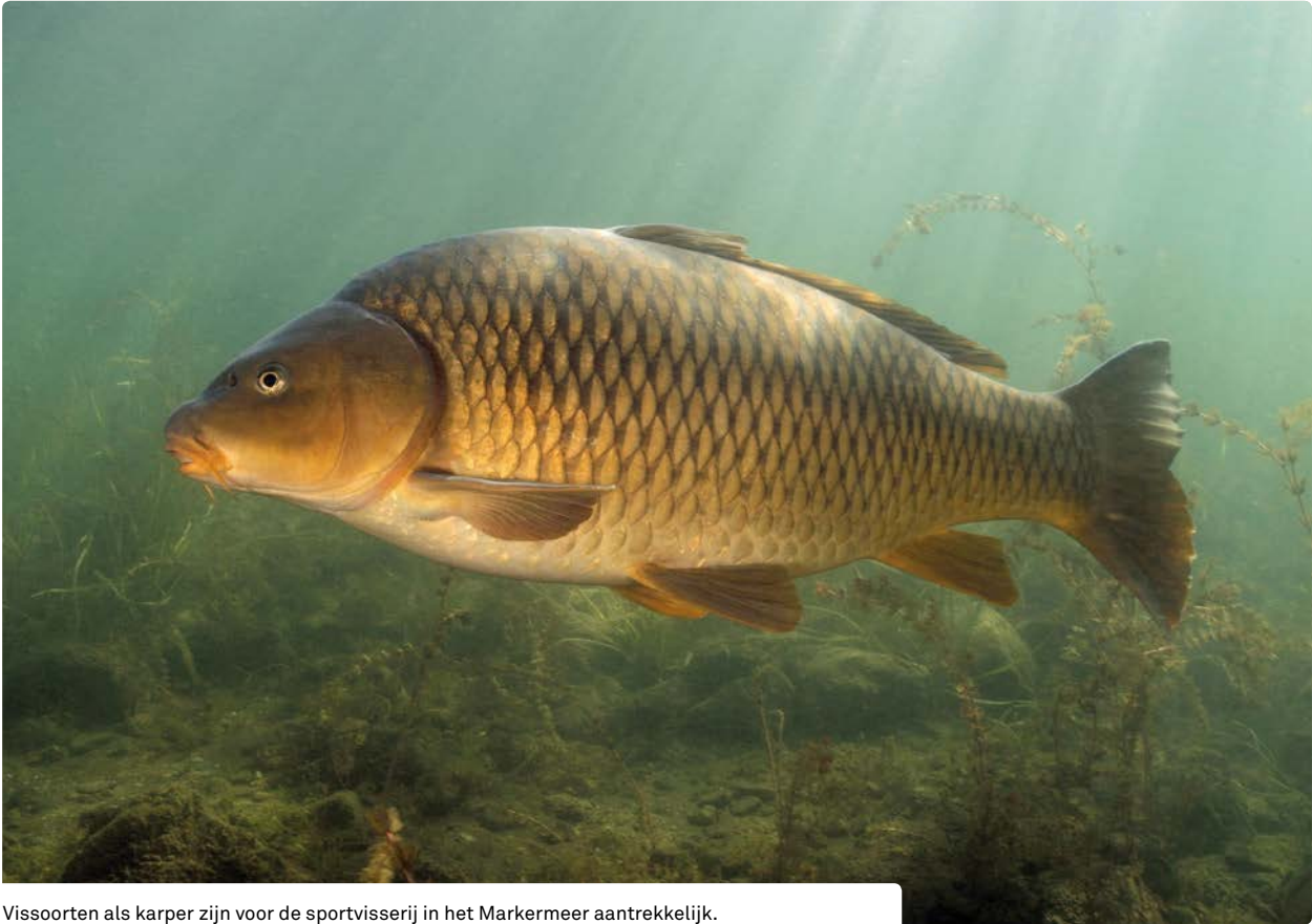
Vissoorten als karper zijn voor de sportvisserij in het Markermeer aantrekkelijk.

model gebruikt. Dit model is ontwikkeld door Deltares en berekent het potentieel voorkomen van ecotopen. Met de ecotopenverdeling is het mogelijk om op basis van geschikt habitat het potentieel voorkomen van vissoorten te bepalen.