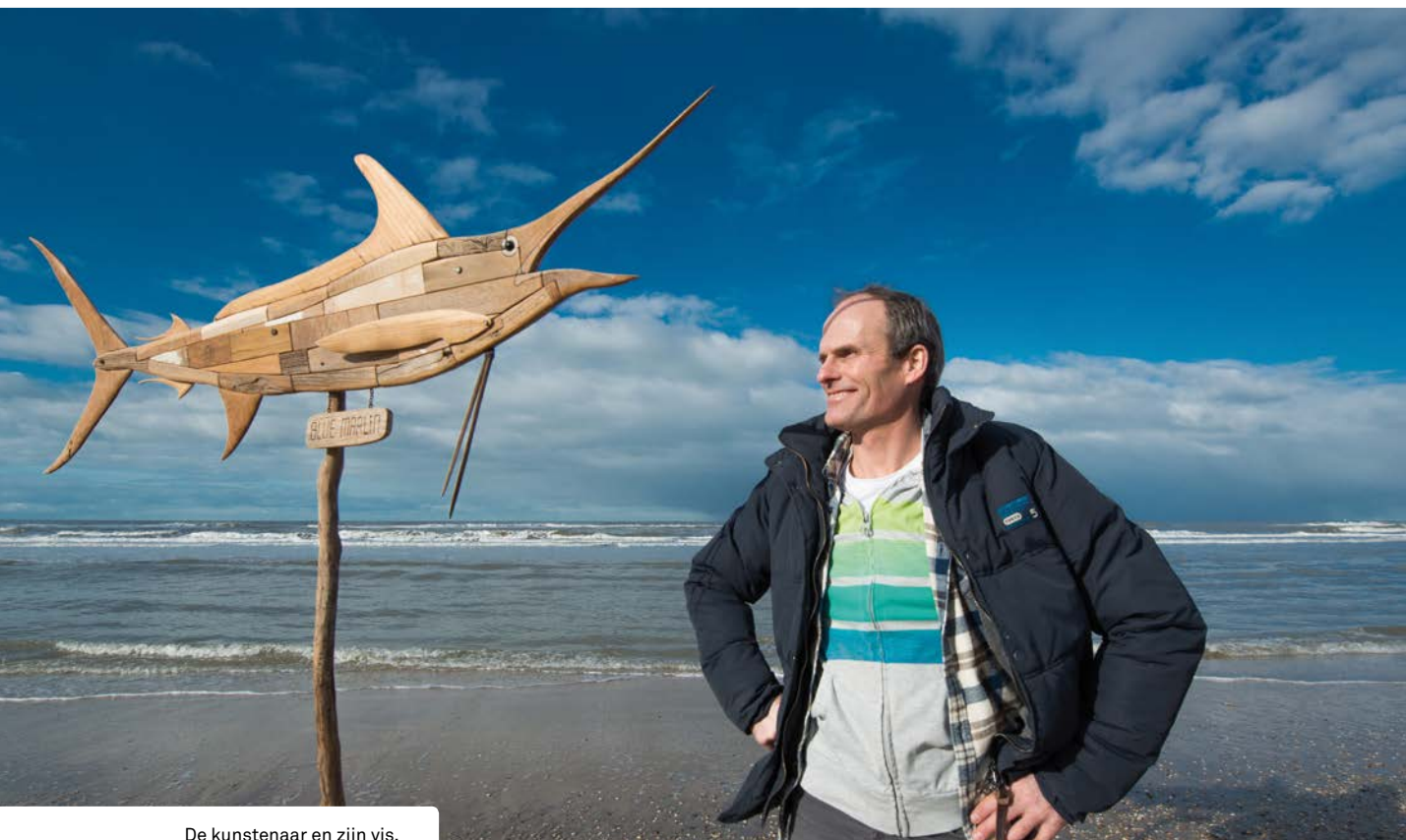
De kunstenaar en zijn vis.

puntige staart, de vinnen en andere uitsteeksels, heb je werkelijk stevig hout nodig.”