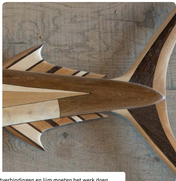
De beelden zijn opgebouwd uit verschillende kleuren en soorten hout. Houtverbindingen en lijm moeten het werk doen.