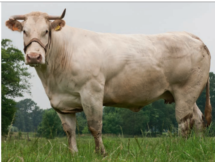
Urielle werd acht keer nationaal kampioen bij de blonde d'Aquitaines en groeide in de afmestfase nog zo'n 2,5 kilo per dag

tionaal kampioene, dertien keer werd ze algemeen kampioene.'