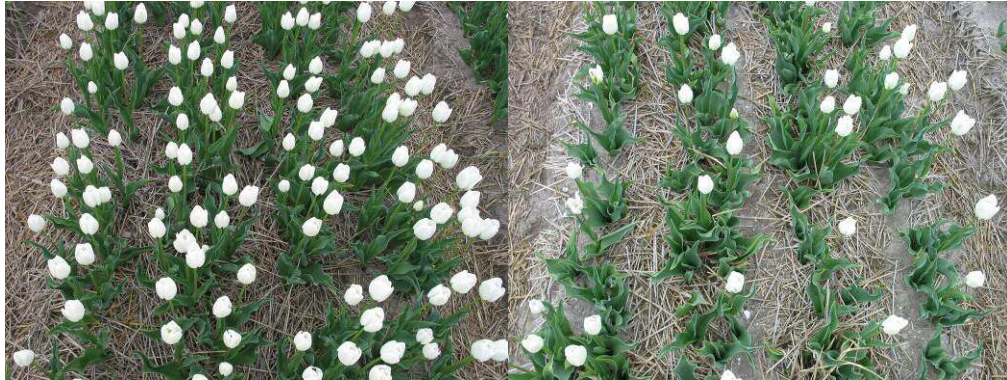
Bloei van White Dream. Rechts onbehandeld (met ethyleen), links met EB-01 behandeld (met ethyleen)