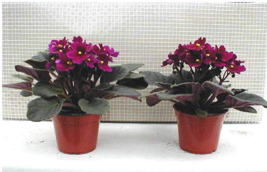
Figuur 1 – Verschil in groei van plant bij tafelverwarming aan (links) en tafelverwarming uit (rechts) bij normale plantafstand en teelt op bevoeiingsmatten.