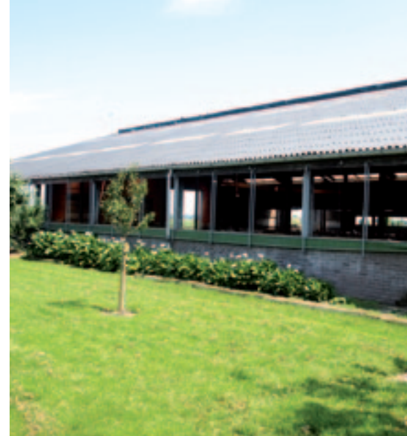
De stal is voorzien van een automatisch gestuurd windzeil.