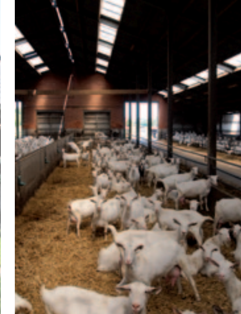
De stal is licht en fris. Aan dat laatste helpt de zeewind deels mee.