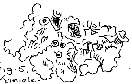
fig. 5. Kanaal- mos. Barnetia acetabulum. jong: CuSO_4 - blauw. ouder-nat: helder groen - dijfbruin. ouder-droog: groengrijs - bronskleurig. zeer oud: grijsbruin.