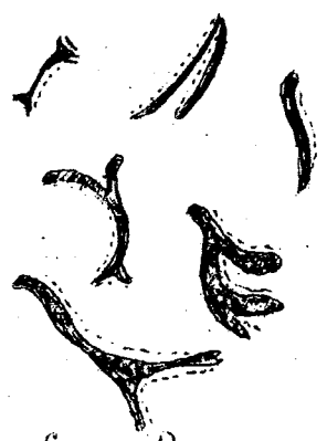
fig. 3. Rutenmos. een Graphidacee.