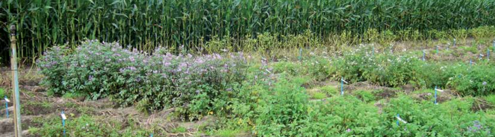
Wagenings proefveld met wilde aardappelsoorten