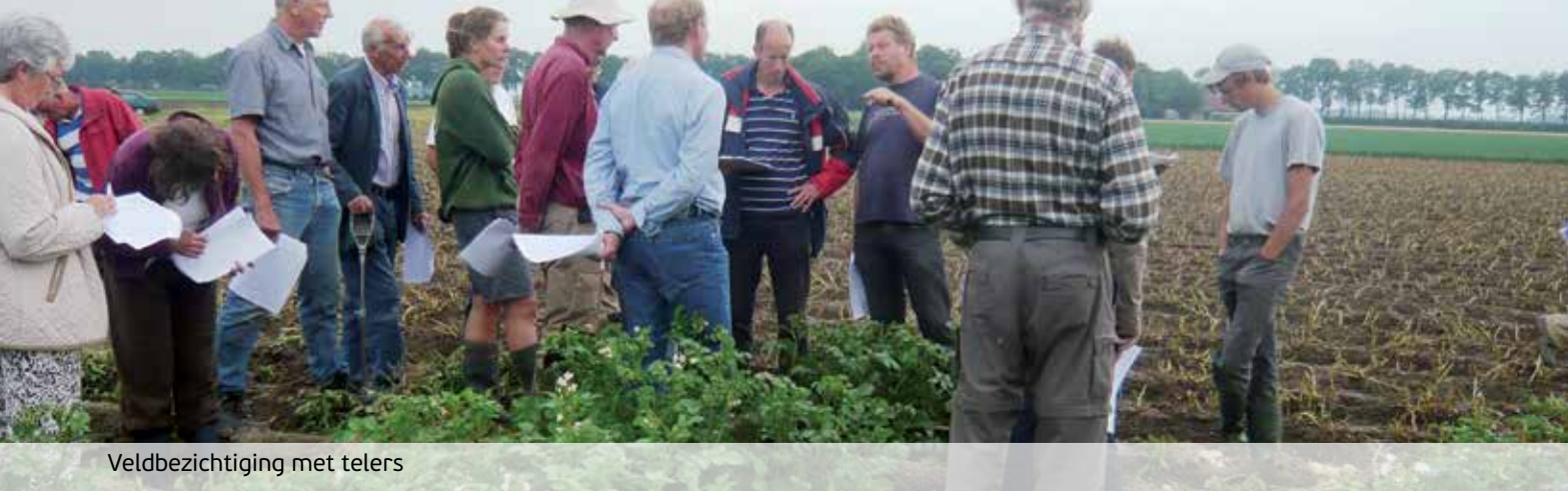
Veldbezoeking met telers