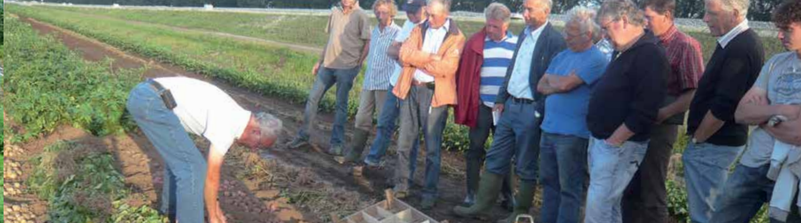
Selectie cursus in het veld