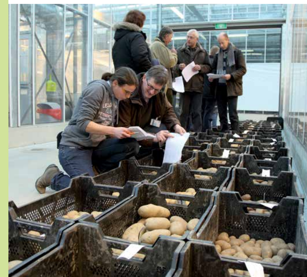
Bioimpuls-klonen in de bezichtiging

Het veredelingsproject Bioimpuls werkt via een korte, midden en lange termijn traject aan resistenties tegen phytophthora. De basis van het project is het kruisingswerk met wilde phytophthora-resistente aardappelloorten (zie foto pagina 2) die Wageningse onderzoekers al decennia geleden verzameld hebben uit Midden- en Zuid-Amerika. Het is een lange weg om de wilde soorten met cultuurmateriaal te kruisen tot een niveau waarop ze als bruikbare geniteurs kunnen dienen voor een commercieel veredelingsprogramma. Dat vergt drie tot vier terugkruisingsgeneraties van elk vier of vijf jaar, dus in totaal 12 tot 20 jaar. Door herhaalde malen te kruisen met cultuurmateriaal (een modern ras) wordt geprobeerd het verkregen plantmateriaal aan te passen aan onze lange daglengte. Verder wordt geselecteerd op de gewenste resistentie(s), maar ook tegen onge-