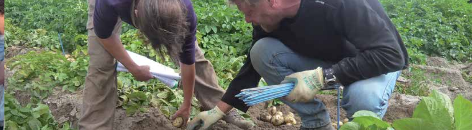
Selecteren in 2e jaars klonen (Bioimpuls-Kraggenburg)