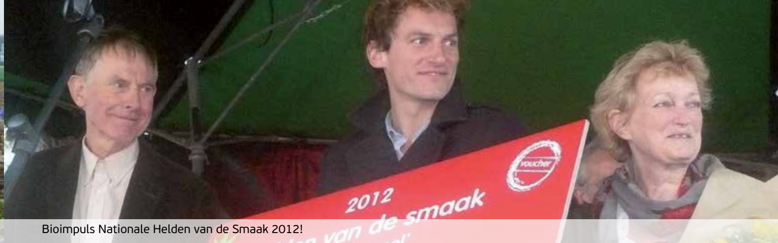
Bioimpuls Nationale Helden van de Smaak 2012!