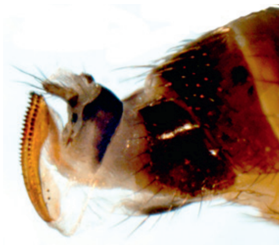
Legboor van de suzuki-fruitvlieg.