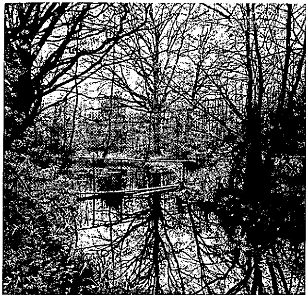
In het elzenbroekbos, terrein van hoge wetenschappelijke waarde.