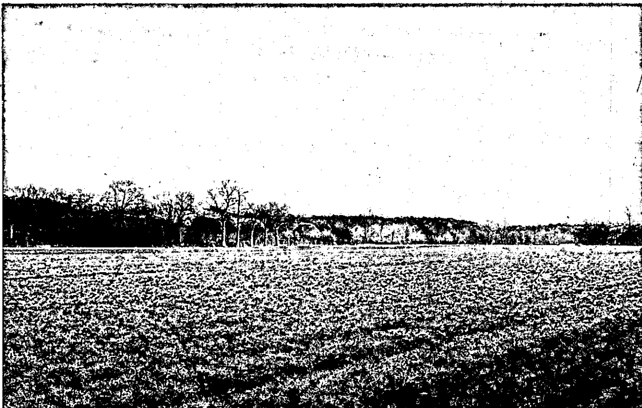
Groveden (1+1) herkomst Hoenderlo, Denemarken en Noorwegen.

plantmateriaal voor een verantwoorde prijs kan worden afgezet. Indien de beseigenaren zekerheid willen hebben dat zij het geschikte plantmateriaal voor een redelijke prijs kunnen verkrijgen dan zijn er in feite slechts twee mogelijkheden nl. óf het zelf gaan telen óf het laten telen op contract, bij daarvoor in aanmerking komende kwekers. Het telen van kwaliteitsplantsoen is vakwerk en vraagt grote investeringen. Slechts zeer grote bosbezitters als de Overheid zullen hiertoe in bijzondere gevallen kunnen besluiten.