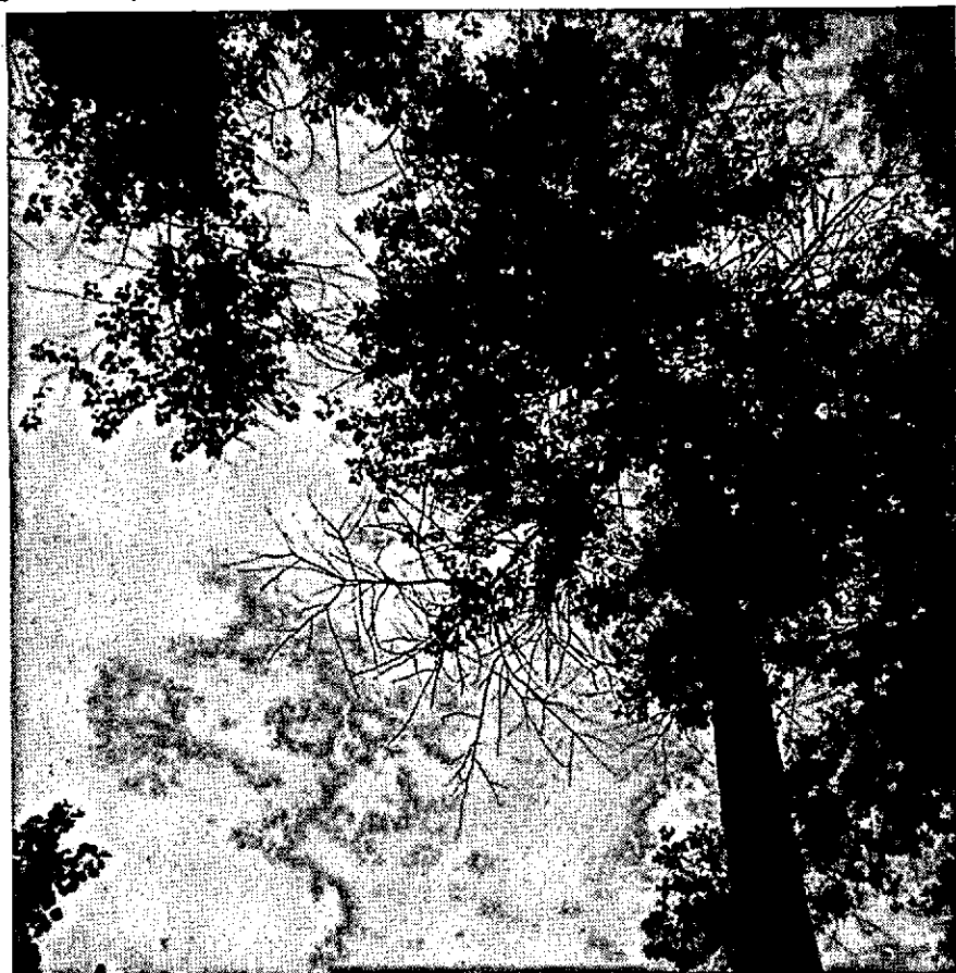
Fig. 3. Taksterven van 30-jarige 'Marilandica' als gevolg van Dothichiza (Dieback of branches of 30-year old 'Marilandica', caused by Dothichiza ).

Voor het verklaren van de groeistoornissen als een gevolg van roest pleit in de eerste plaats het samenvallen van het begin van deze groei-remmingen met het op grote schaal planten van lariks in en nabij populierenbeplantingen. Verder het ontbreken van een opvallende achteruitgang in groei bij klonen die geen of relatief weinig roest vertonen. Voorts het feit, dat de het sterkst door roest aangetaste beplantingen de grootste achteruitgang in groei vertonen, terwijl deze buiten het „roest-gebied” bij dezelfde cultivars en zelfs klonen niet optreedt (Fig. 1).