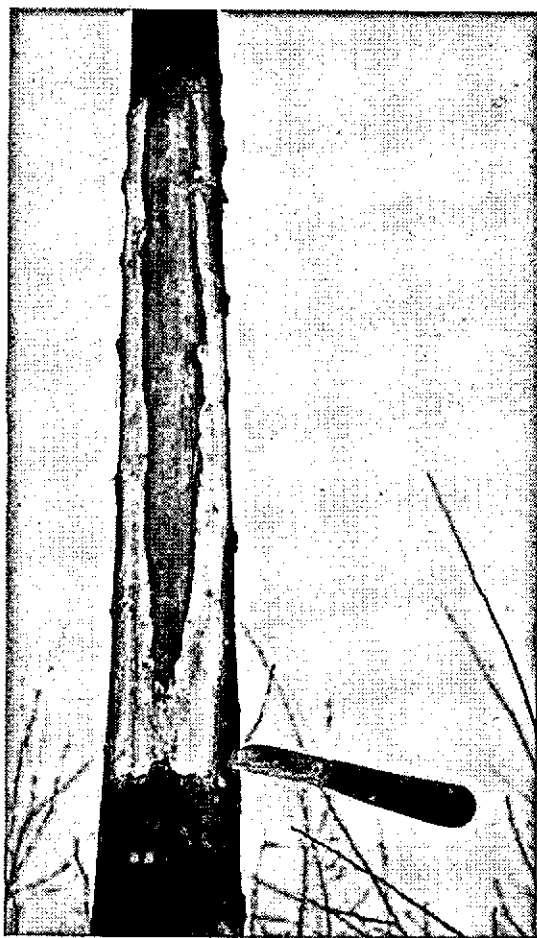
Fig. 4. Verloop van de aantasting door Dothichiza in de stam, uitgaande van een takbasis, zichtbaar aan verkleuring van het opengelegde hout (Extension of necrosis by Dothichiza on the stem, starting from a branch, evident by discoloration of the wood)

Dat de lariks bij het optreden van de roest een beslissende rol speelt, is bewezen bij in 1957 uitgevoerde uitgebreide fenologische waarnemingen. Met zekerheid werd geconstateerd, dat na juni de roestaantasting zich, uitgaand van een lariksbeplanting (soms maar enkele bomen!) in de populierenbeplanting uitbreidt.