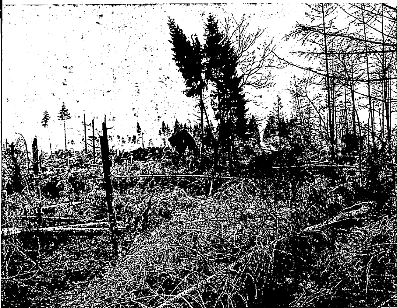
... ca. 30 ha volledige vernieling.