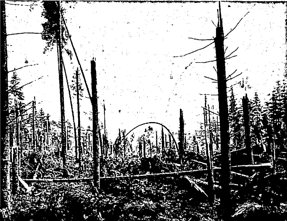
Abies grandis bij Schoonlo