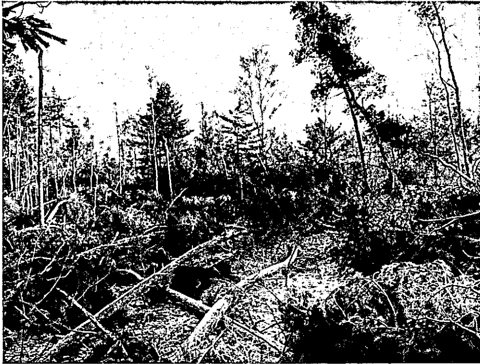
Schadebeeld van de Veluwe