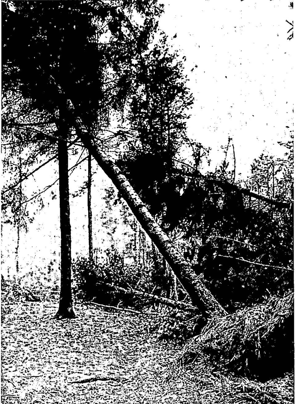
Corsicaanse den op Texel