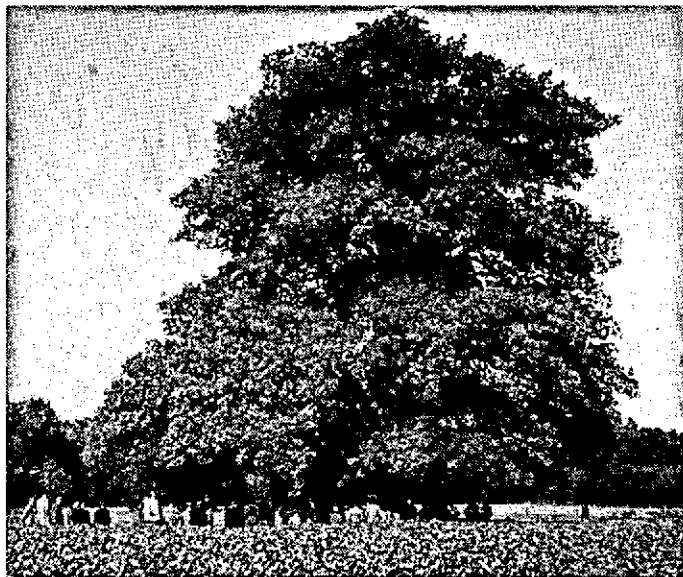
Afb. 3. De dikke eik van Verwolde.