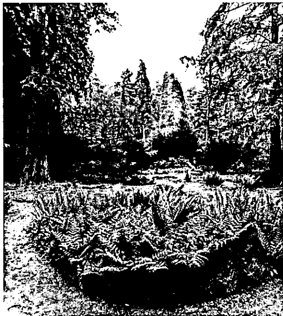
Een groot en klein pinetum en een arboretum: De Schovenhorst is een bosmuseum.

geplant. Nu pas, na 85 jaar, weten we een beetje waar we aan toe zijn met het toen geplante hout.