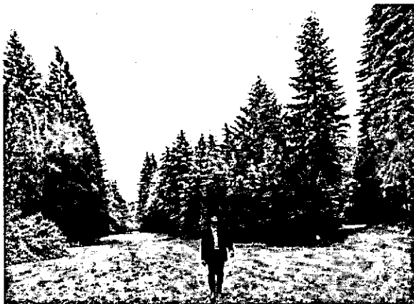
Hier hebben bosbouwkunstenaars gewerkt.