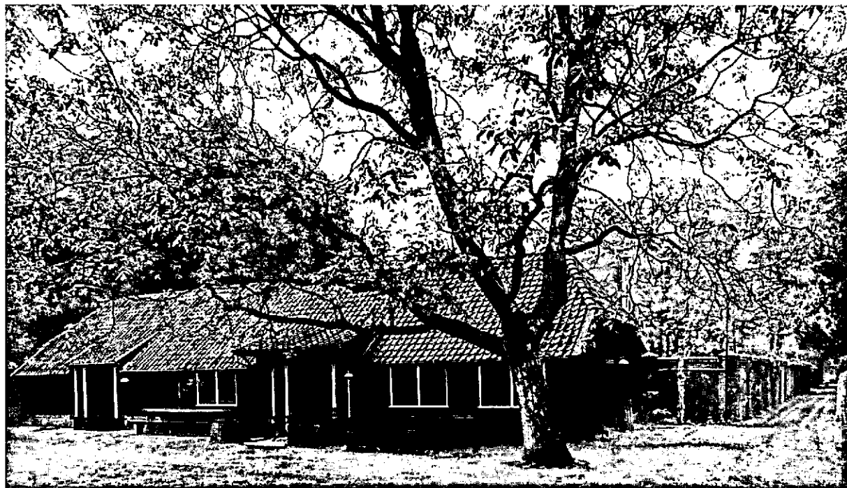
De Werkstee, centrum van bosstudie.

Er is tenslotte nog één wens: misschien zou er nog wat meer gelegenheid moeten komen tot het verkennen van elkaars terreinen.