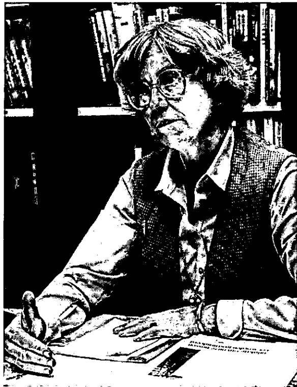
“Houtproductie is natuurbehoud.”