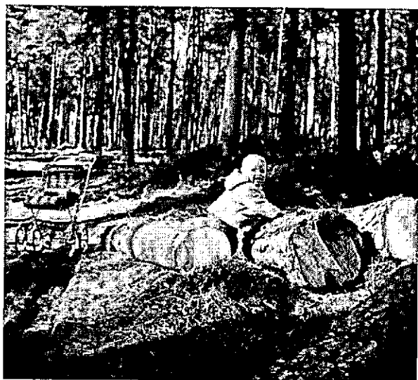
Recreatie in de kinderschoenen.

van het natuurhistorisch museum, daarbij verwijzend naar het Amerikaanse „trail-side Museum”. Het streven door middel van informatie de bezoeker meer vertrouwd te maken met wat voor hem interessant is in het te bezoeken gebied, verdient alle aanbeveling. Echter niet door de collecties te vergroten en verbreding te zoeken in het toevoegen van andere onderwerpen. Het grote publiek heeft geen enkele behoefte aan uitgebreide collecties over wat er in het gebied voorkomt. Dit zijn gegevens voor de gericht geïnteresseerde,