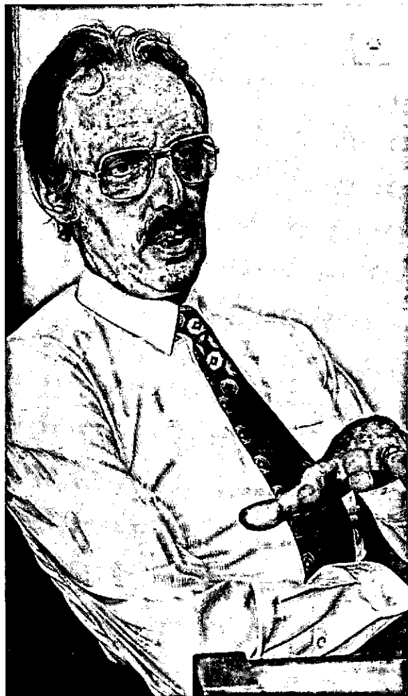
“Grootschalige bosbouw kunnen we hier niet waar maken.”