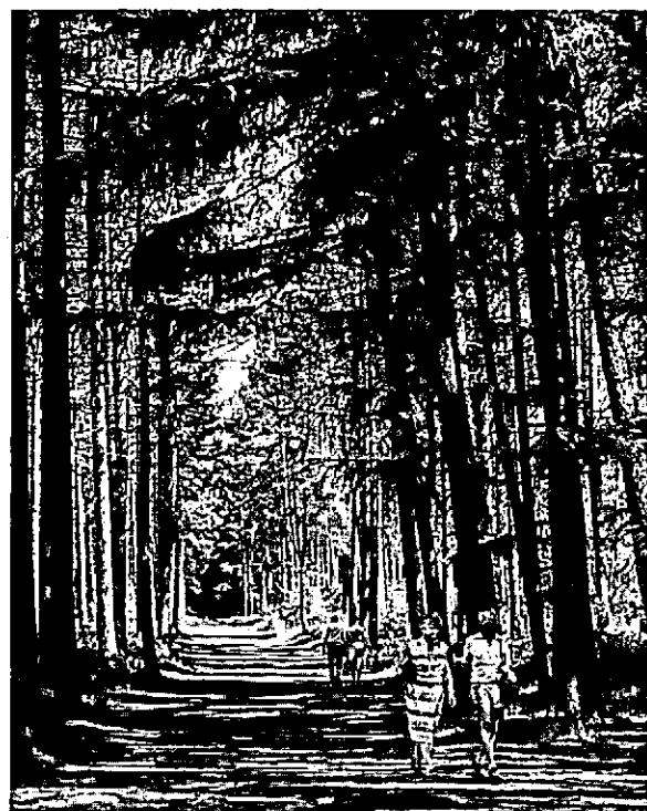
Een prachtige laan waar het publiek graag doorheen wandelt.