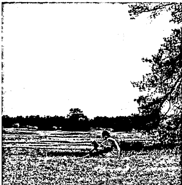
Het open landschap van het nationale park.

naal park. In vergelijking echter met het buitenland waar alles op grote schaal is, moet hier worden gesproken over "een vierkante meter-beheer" zoals Stefels het noemt. "In het buitenland kunnen doelstellingen als grootschalige bosbouw waar worden gemaakt. Hier kun je nog geen honderd meter buiten de grens van het park komen of er ligt een schietbaan of iets dergelijks. In vergelijking tot de grote parken in het buitenland is in Nederland natuurbeheer kruideniersbeheer en dan is De Hoge Veluwe daarin nog een V en D", aldus Stefels.