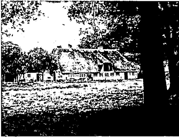
Eén van de vernieuwde boerderijen in de buurtschap Junne; de boerderij "Siegering".