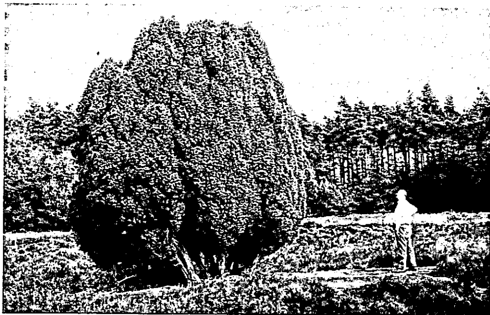
Ook in het "gecultiveerde" gedeelte werden enkele idyllische plekjes gespaard; enorme jeneverbes op helde.

Het gereedmaken van zo'n verkoping, het "etaleren" en sorteren, kost vanzelfsprekend extra tijd, destijds gesteld op ongeveer 1½ manuur per m 3 . Met het stijgen van de