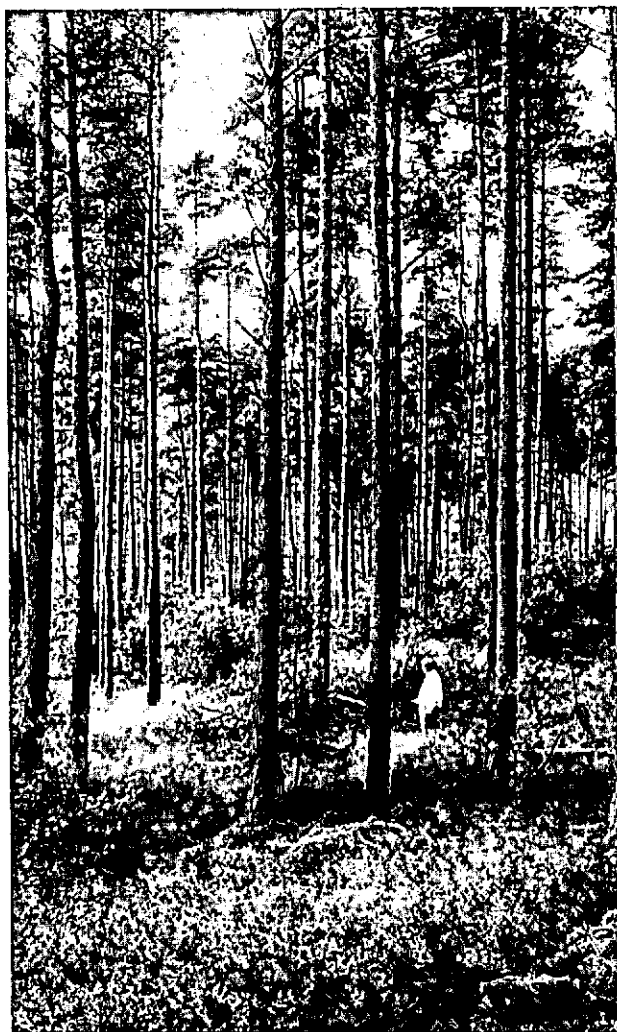
Vak 21 (afd. c; de moederopstand (selectie-a) waaruit de loten zijn gesneden ten behoeve van de zaadtuin; opvallende hoogtegroeï, smalle kronen en rechte stammen.

loonkosten werd ook de marge, het voordeel ten opzichte van een verkoop aan de handel, kleiner. Misschien is het punt waarop ook deze wijze van verkoop van licht dunningshout de kosten niet meer dekt, zeer nabij of reeds bereikt, maar het voordeel, dat in de laatste 20 jaren de herbebossingen met de bedoelde houtsoorten consequent om de twee à drie jaar werden gedund, zal gedurende deze omloop een blijvende nawerking hebben.