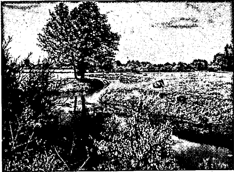
Foto 4. In 't Twentsche landschap ziet men steeds een gekartelde einder van oud en jong „gebruiks-houtgewas”.