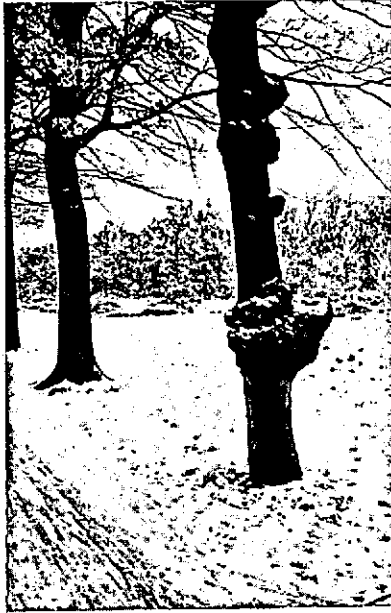
Foto 3. De Utrechtsche weg tusschen Heelsum en Oosterbeek geeft in de beuken- rijen langs het fietspad „gaten in de rij” te zien die niet en afwijkende boomen die zeer opvallen.