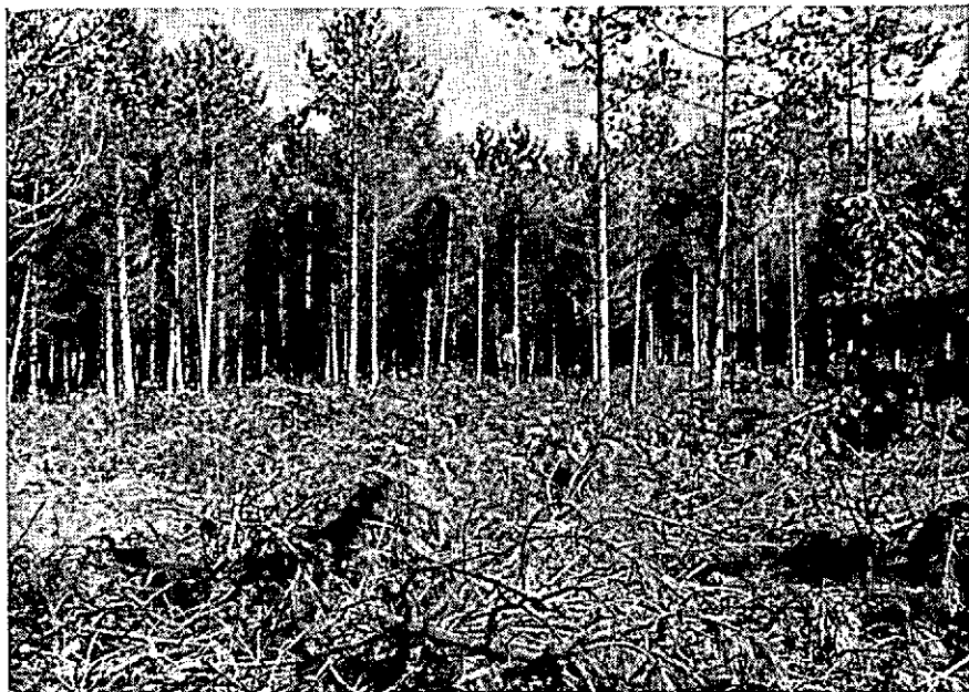
Fig. 2. Sterfte-plek in vak 16 g, Willemsbos, Nunspeet (zie figuur 1). (Group-dying in plot 16 g)