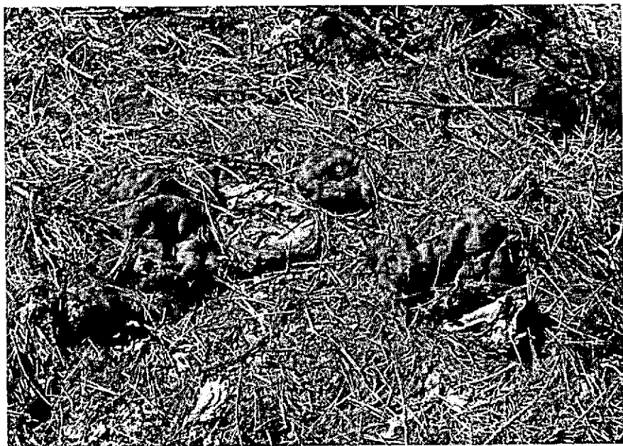
Fig. 3. Apotheciën van Rhizina undulata , Willemsbos, Nunspeet. (Apothecia of Rhizina )