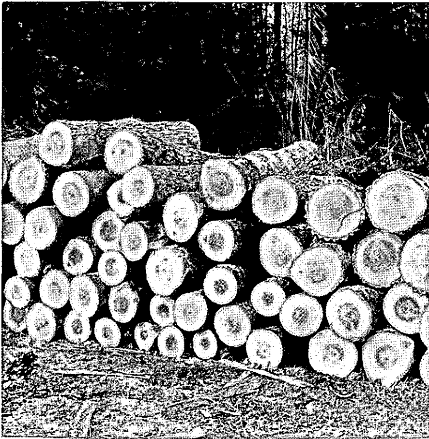
Papierhout, wachtend op transport.