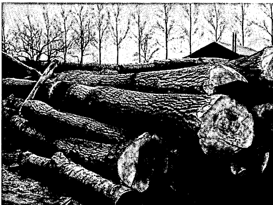
Opslag van populierehout bij een klompenmakerij.

slechts 1.000 m 3 van collega's. De uitsluitend rondhoutverwerkers betrokken slechts 16.200 m 3 van de handel, zodat kan worden aangenomen, dat een groot gedeelte van het tropische rondhout dat de handel Importeerde werd doorverkocht naar het buitenland, ook al omdat uit tabel 3 blijkt dat de 537 bedrijven, die (ook) in Nederland niet-tropisch rondhout kochten de door hen gekochte hoeveelheid tropisch rondhout voor ca 90% zelf geïmporteerd bleken te hebben. Van de 59.800 m 3 , gekocht door bedrijven die zowel rondhout verhandelden als verwerkten, werd 3.600 m 3 in ronde vorm doorverkocht. Het overgrote deel werd dus in eigen bedrijf verwerkt. Dit laatste geldt ook voor het door deze categorie geïmporteerde niet-tropische rondhout: van de 10.900 m 3 bleek er 8.000 m 3 in eigen bedrijf te zijn verwerkt en 2.900 m 3 in ronde vorm te zijn doorverkocht. Overigens werd de grootste hoeveelheid niet-tropisch rondhout geïmporteerd door de bedrijven, die in de rondhoutbranche uitsluitend als handelaar optraden (94.000 m 3 ).