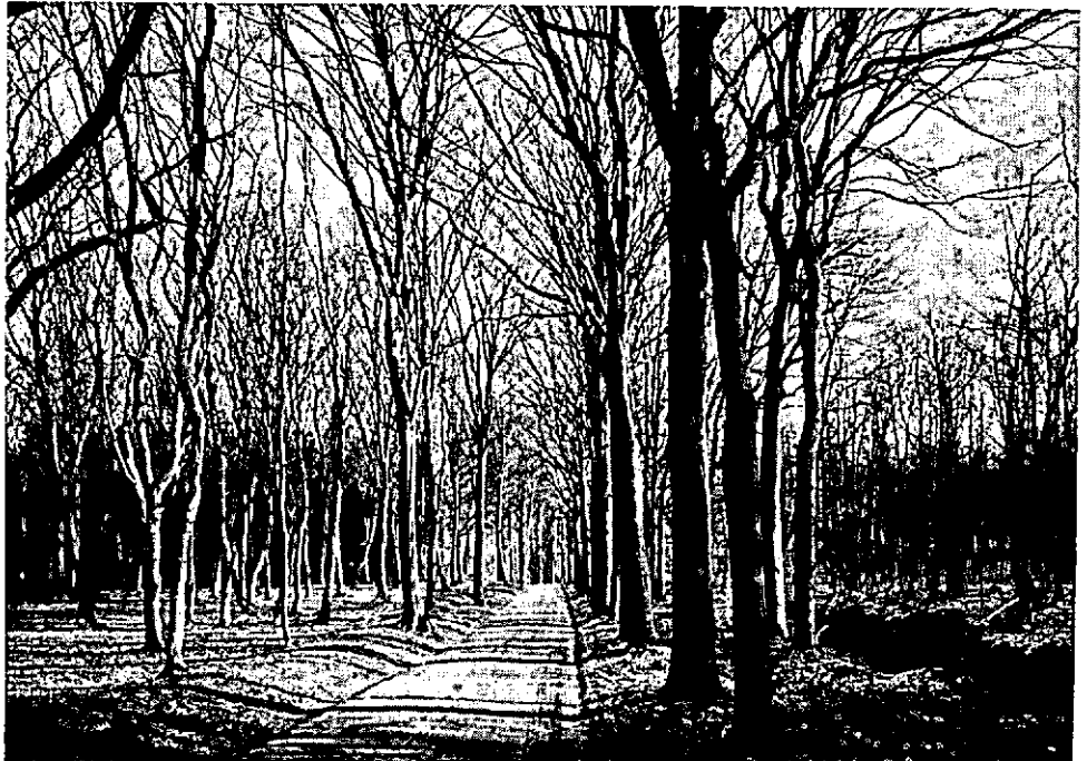
Boombos met achter de wal (rechts op de foto) spaartelg. Links op de achtergrond een omvorming van het boombos met naaldhout.

In 1806 en 1807 werden enkele uitgaven, resp. van f 2 = 16 = f 14 = voor dennezaad vermeld, zonder de hoeveelheden aan te geven (3 pond en 14 pond?). Daarna duurt het weer tot 1821 dat er weer iets wordt aangekocht (14 pond), gevolgd - met enkele onderbrekingen - door vaak grote hoeveelheden van verschillende leveranciers, waaronder sedert 1890