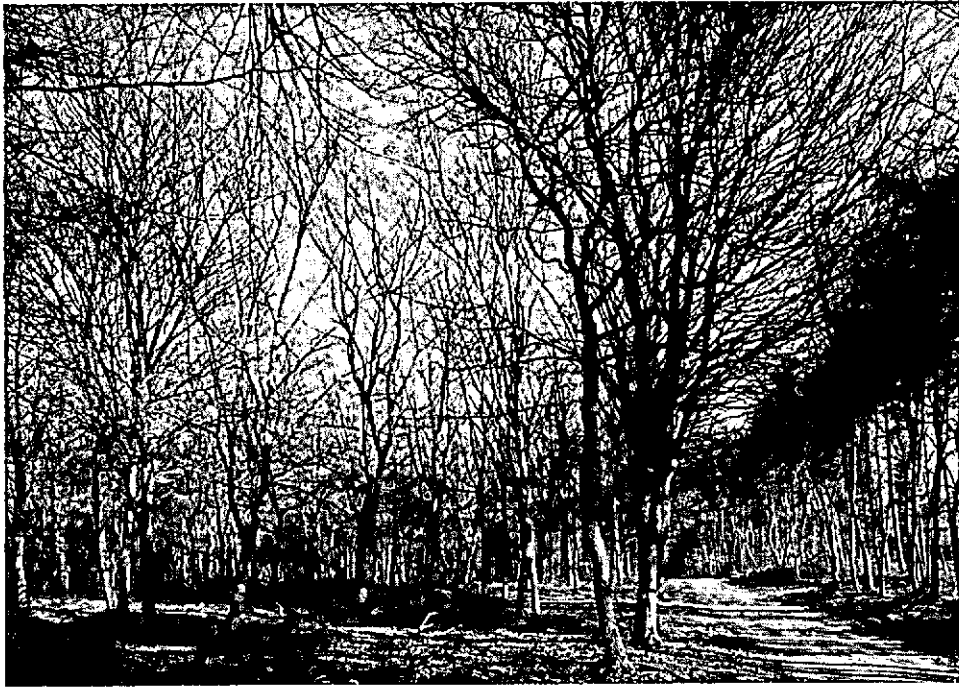
Relatief jong boombos bestaande uit eik, beuk en een weinig winterelk.

strengere vorst, schadelijke rupsen en veelvuldige Dieverijen, waardoor het Speulderbosch merkkelijk is gedetioereert en alsoo eene ruïne ten minste een groote vermindering van inkomsten moeten na sijn slepen, hebben de respectieve Maalen om gunt voorschreven goedgevonden, tot soulaes in desen, te introduceeren eenige pointen van Menage."