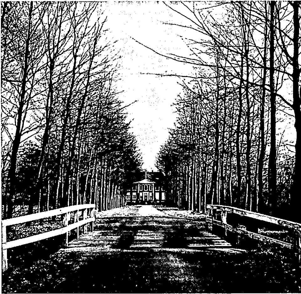
Het Huis te Diepenheim.

dat het bezoek aan terreinen duidelijk afgeremd werd door het feit dat de bezoeker genoodzaakt was om zich een toegangsbewijs aan te schaffen, zulks ondanks het bestaan van tamelijk algemeen geldige wandelbewijzen van de ANWB en van de Vereniging tot Behoud van Natuurmonumenten in Nederland en ook ondanks de steeds stijgende stroom bezoekers van het Nationale Park "De Hoge Veluwe", waar een flinke entree wordt geheven. Betrouwbare statistische gegevens over die "drempelwerking" van de toegangskaarten ontbreken echter.