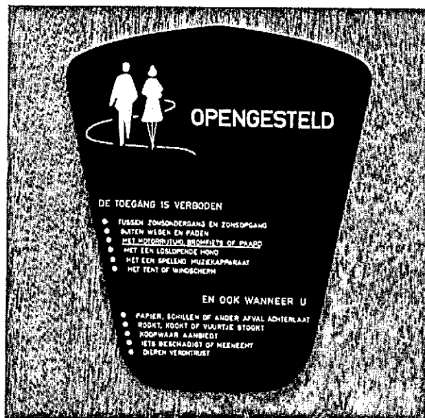
Het bekende teken dat hier de Bosbijdrageregeling geldt.

Om het totaalbeeld niet te laten vertroebelen door transacties rond landgoederen, die slechts betrekkelijk korte tijd onder de Natuurschoonwet gerangschikt waren, beperken wij ons voorts tot de terrei-