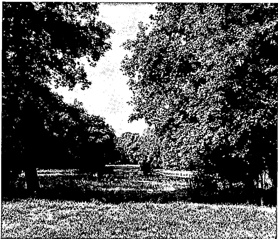
De Wamberg: een opengesteld NSW-landgoed in Noord-Brabant.

Sedert 1966 is het niet meer alleen de Natuurschoonwet, die landgoedeigenaren tegemoet komt in de kosten en lasten die hun bezittingen met zich brengen. In dat jaar werd namelijk de mogelijkheid geschapen om een bijdrage te ontvangen in de kosten van instandhouding en toegankelijkstelling van bossen. Daartoe was de "Bosbijdrageregeling" in het leven geroepen. Deze regeling is alleen van toepassing op bossen van tenminste 10 hectaren en dus niet (zoals de Natuurschoonwet) ook op door beplantingen omgeven percelen landbouwgrond of grasland. Zij beoogt in de eerste plaats de vrije toegankelijkheid van het Nederlandse particuliere bosbezit voor het publiek te bevorderen. In beleidskringen had men namelijk de indruk