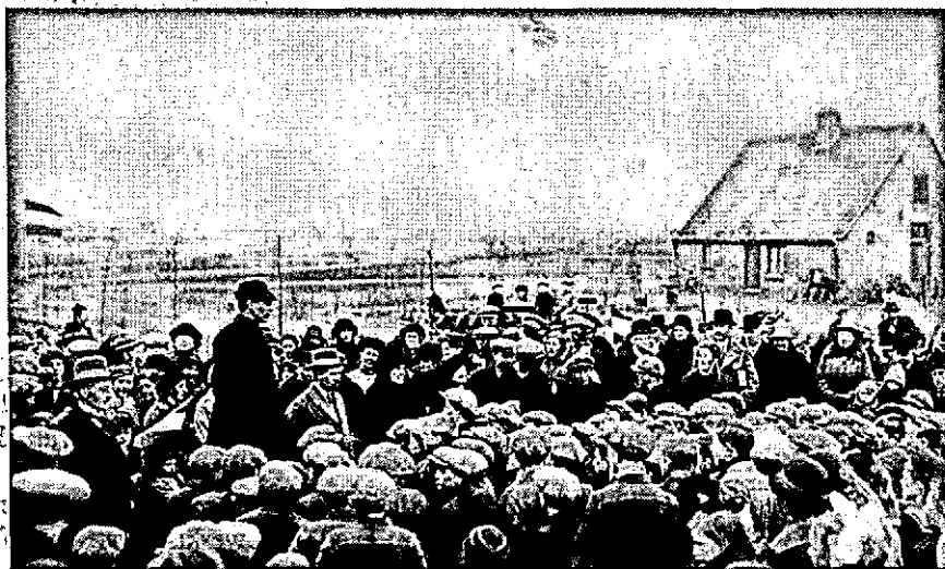
Boomplantdag 1924, Giëten.