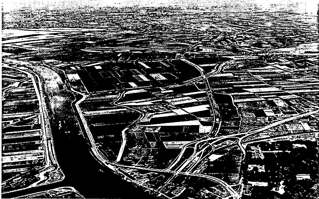
Luchtfoto van het toekomstige recreatiegebied Spaarnwoude. Links het Noordzeekanaal. Linksachter Amsterdam met het toekomstige industrieterrein (wit). Rechtsvoor Velzen. Rechtsachter de Mooie Nel met Spaarnwoude.

creatie en Maatschappelijk Werk en de Rijksplanningologische Dienst aan de stuurgroep toegevoegd.