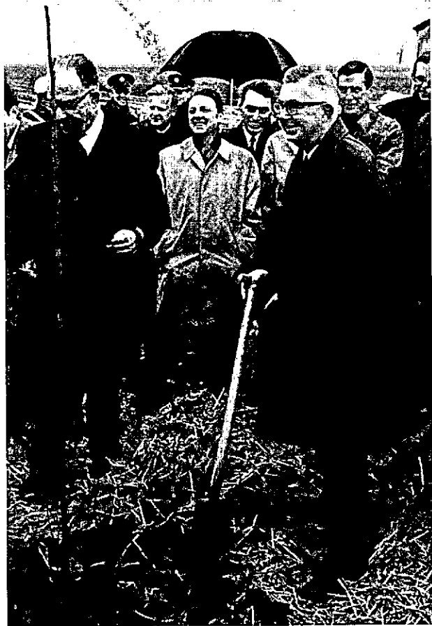
De staatssecretaris (rechts) beziet het resultaat van zijn arbeid: de eerste boom in Spaarnwoude staat!

reiding zijnde element voor de dagrecreatie. Reeds in 1965 verenigden vertegenwoordigers van de gemeenten Haarlemmerliede en Spaarnwoude, Haarlemmermeer, Velsen, Haarlem en Amsterdam en het Provinciaal Bestuur van Noord-Holland zich in een zogenaamde stuurgroep, teneinde plannen te doen uitwerken om tot inrichting van dit recreatiegebied te komen. Van de zijde van het Rijk werden vertegenwoordigers van het Ministerie van Cultuur, Re-