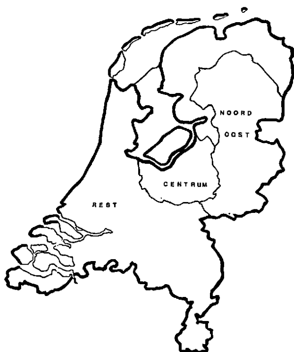
Figuur 1. Indeling van Nederland naar regio.