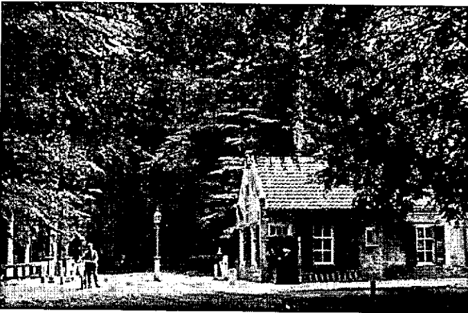
Het Tolhuis aan de Middachter Allee aan de Ellecomse kant omstreeks 1900