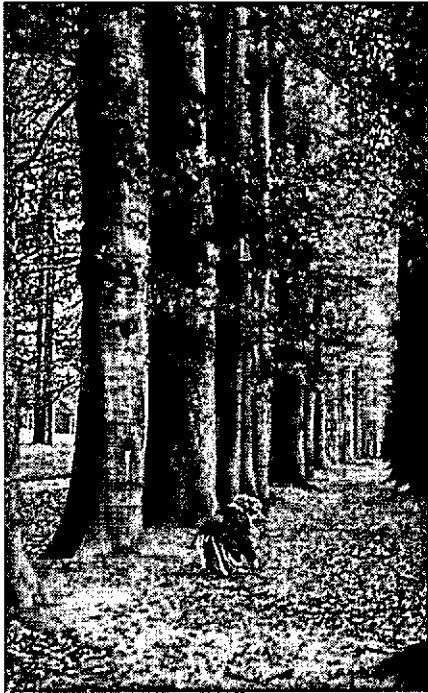
De laatste oogst oktober 1956

Het archief van Middachten geeft geen uitsluitel omtrent de ouderdom van de Middachter Laan als weg. In het rijks-archief te Arnheim bevindt zich een kaart van 1629, waarop de weg nog niet staat aangegeven. Het is de „Nieuwe perfecte kaart van d'Yselstroom met een gedeelte van de Veluwe, waarin curieus naar de mate verthoont wort de inval van Graaf Hendrik van den Berg met zijn bijhebbende Spaanse en Keyzersche krijgsmacht, mitsgaders haar kwartieren, schansen en legerplaatsen". De kaart werd gedrukt te Amsterdam bij Claes Janszn. Vischer. (Alg. verz. nr 197).