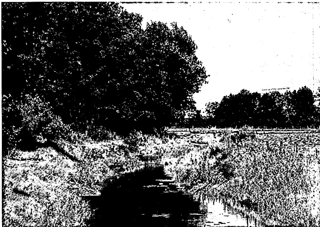
■ Natuurontwikkeling binnen beeksystemen is gewenst

een duurzame instandhouding en ontwikkeling binnen beheerbare eenheden. Dit gaat veelal samen met het realiseren van grotere eenheden. In de Drentse situatie in het bijzonder het zoveel mogelijk completeren van beeksystemen, inclusief bron- en voedingsgebieden. Ook verbindingsozones tussen gebieden met natuurwaarden zijn daarbij wezenlijk.