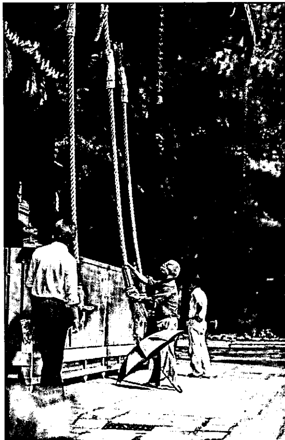
Het zeggan van een gebed bij de Yasaka Jinja tempel in het stadspark van Kyoto. Dit wordt begeleid met het rammelen van een soort bel en kort handgeklap.

Om het beleidsuitgangspunt te verwezenlijken heeft de nationale overheid in 1981 ruim één miljard gulden uitgetrokken. Naar verwachting zal in de komende vijf jaar hiervoor in totaal ruim 34 miljard worden uitgegeven. Als verdeelsleutel wordt gehanteerd dat 37% naar parken gaat die specifiek voor de bevolking ter plaatse functioneren. Een vierde deel gaat naar parken van bovenstedelijke betekenis en nog eens 10% naar parken in de regio. Ook wordt gedacht aan het financieren van groengordels die als bufferzones moeten dienen, waarvoor 10% van de te besteden gelden wordt uitgetrokken. Dan zijn er nog projecten die finan-