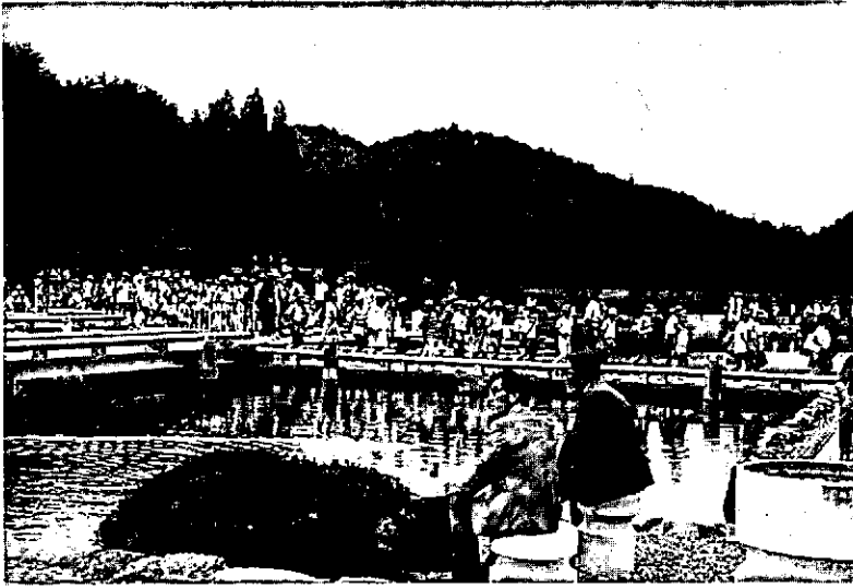
Schoolkinderen op excursie in de omgeving van de internationale conferentiehal in Kyoto.

ving. Het Akasawa bos trekt tussen de 35.000 en 40.000 bezoekers per jaar, een relatief gering aantal indien men bedenkt dat een deel van dit bezoek voor rekening komt van een klein toeristisch attractiepunt, een expositie rond een stoomlocomotiefje dat vroeger gebruikt werd toen het hout nog met een treintje uit de bossen werd gehaald. Ook het spoorlijntje zelf is nog intact gebleven.