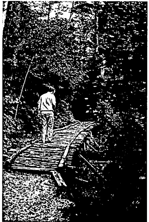
Begaanbaar maken van wandelpaden door middel van knuppelbruggen.

cieel zullen worden ondersteund zoals de groenaanleg bij monumenten en voetgangersvoorzieningen in de parkzones in het buitengebied.