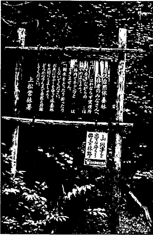
Bebording in het Akasawa bos, min of meer uitgevoerd naar Amerikaans voorbeeld.