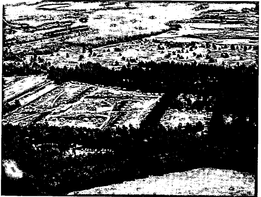
Verblijfsrecreatie aan de rand van meer en minder kwetsbare natuurgebieden. Kootwijk.

Misschien dat het in dit kader goed is om de functie natuurbehoud te verduidelijken. Hierbij wordt uitge-