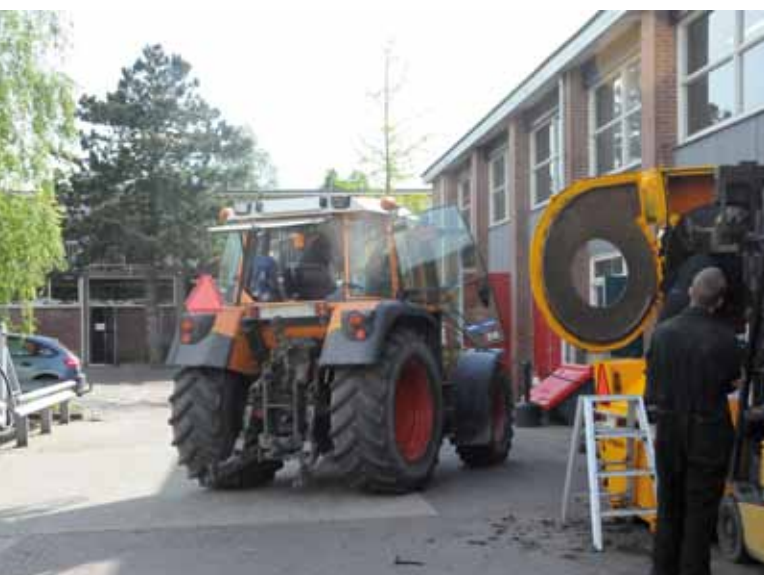
Reparatie machines gemeentewerf Haren