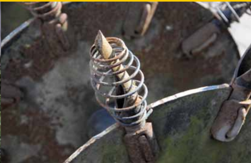
Westpoint Hahn beluchter.