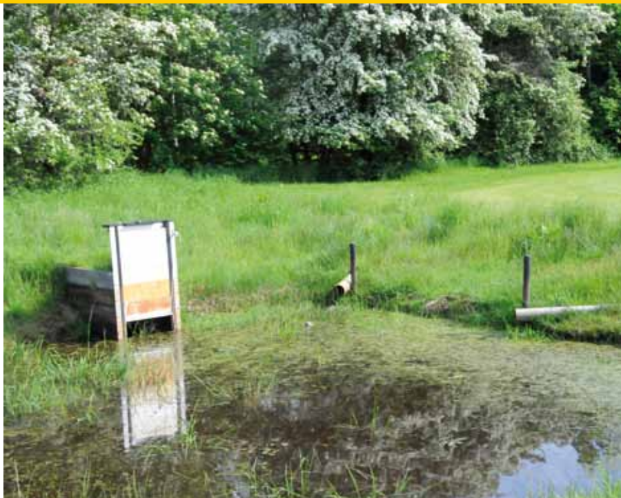
Met deze stuw kan Harm het waterniveau in zijn drains bepalen, rechts de drains

heeft. Volgens Dirkjan Drost van RDM Parts verkoopt zijn bedrijf nog steeds slijtagedelen voor deze beluchter en gaat het waarschijnlijk om een beluchter van het Amerikaanse Westpoint Hahn. Overigens is de beluchter in bijna 40 jaar gebruik verschillende keren stevig verbouwd en is alleen de centrale as nog over van de oorspronkelijke machine. De werktuigdrager hebben de monteurs van Haren er zelf bij 'gefabriekt'. In deze werktuigdrager kan ook een gazonwals gehangen worden.