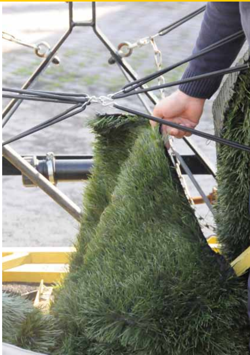
Een oud stuk kunstgras achter de kriebeleg zorgt dat de infill beter verspreid wordt.