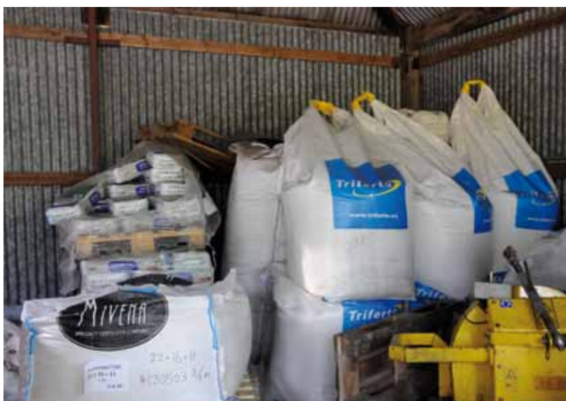
Opslag meststoffen voornamelijk traditioneel met veel aandacht voor sporenelementen.