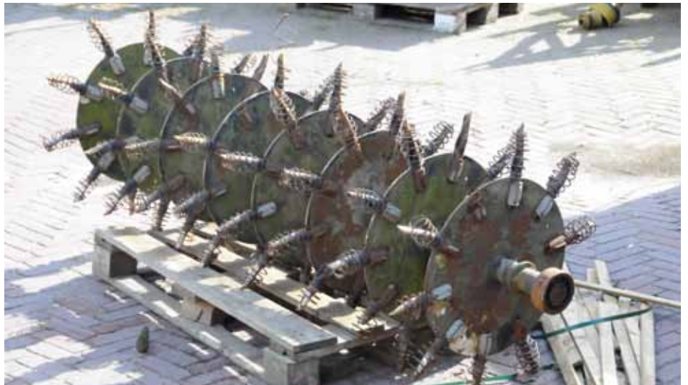
Westpoint Hahn beluchter.

tevreden met zijn oldtimer. Vooral ook omdat je snel kunt werken met deze beluchter: minimaal 8 km per uur. Veel sneller dus dan met een Vertidrain, die Haren overigens ook in de schuur heeft staan. Deze gemeente blijkt later overigens niet de enige te zijn die een dergelijke machine