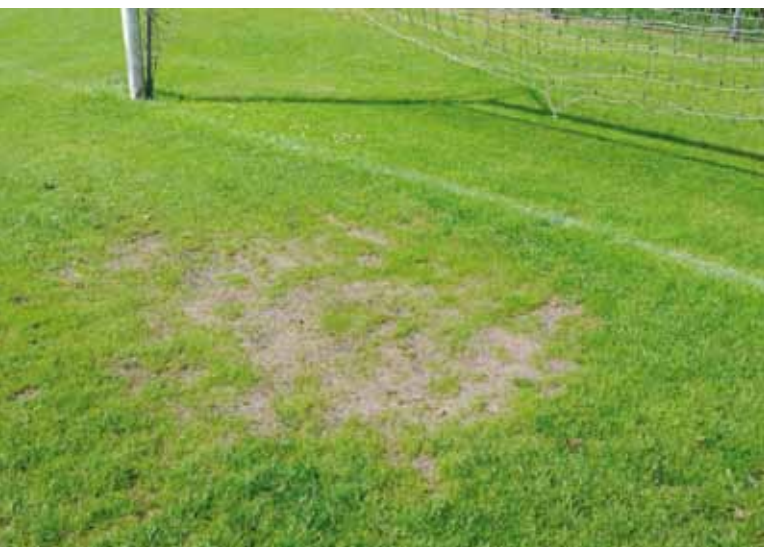
Kale plekken in de doelmond na een vol seizoen.