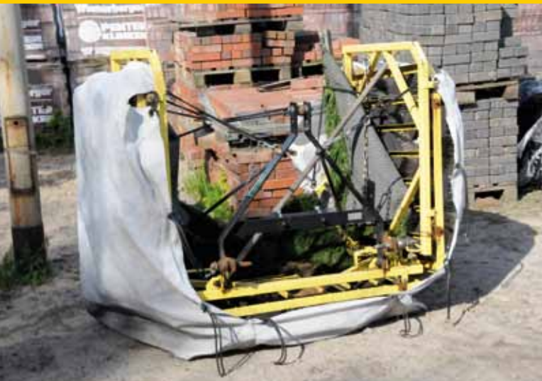
Een eigen vinding: een luier voor de kunstgrasmachine. Infill beland niet op de openbare weg, maar blijft in de luier.