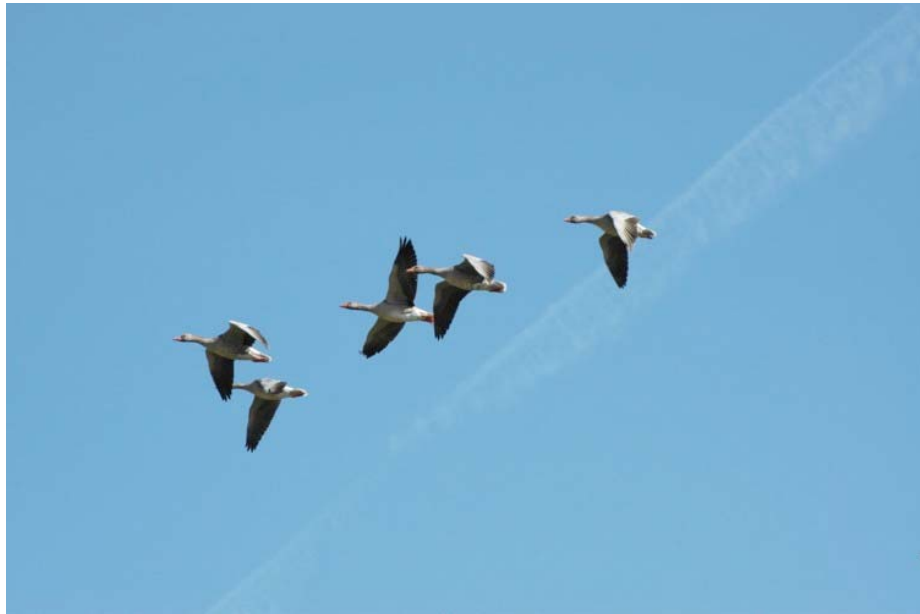
Grauwe ganzen vliegend naar Schiphol.