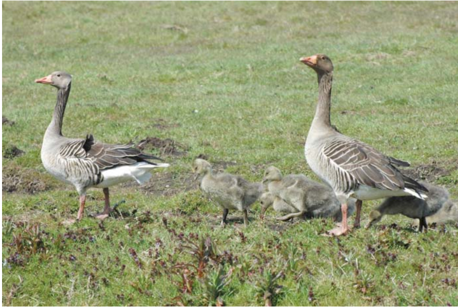
Grauwe ganzenpaartje met jongen. De gent (het mannetje, rechts) spot een vliegtuig (foto Theo van Lent).