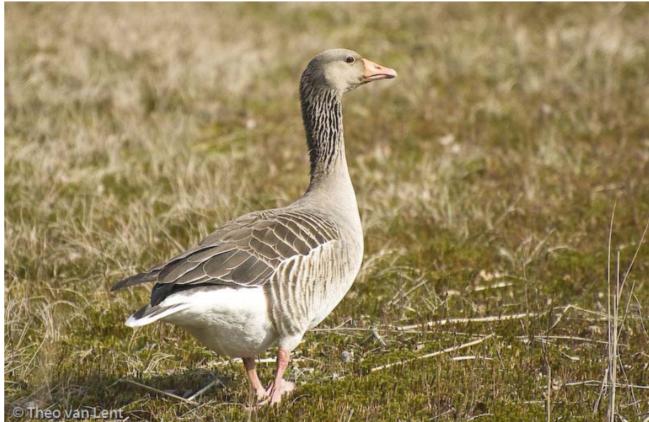
Grauwe gans.