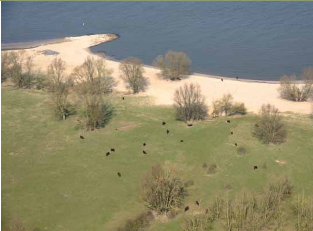
Millingerwaard. Het avontuur van de natuur in de directe nabijheid van eeuwenoude steden, heiligdommen en cultuurlandschappen. Dat hebben ze in de VS niet.

elders in Europa, waar handhaving een stuk minder ontwikkeld is en stroperspraktijken aan de orde van de dag zijn.